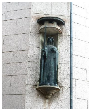
Astri Taubes staty