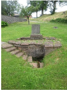
S:ta Elins källa

Biskop Brynolf berättar, som vi nämnt, i sitt officium att Elins kropp fördes tillbaka till Skövde efter mordet. Vid en paus under likfärden bröt en källa fram: "Den kallas än i dag för den saliga Elins källa." Om man inte vill tro på legenden kanske man kan anta att följet stannade till vid en redan existerande källa. Kanske kom den senare att förknippas med Elin, inte ovanligt då det gäller helgon.