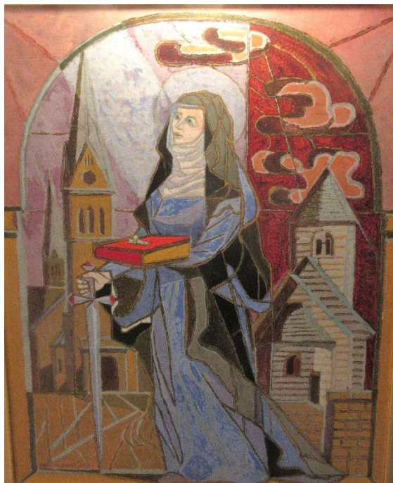
Erik Olsons målning

mantel, svärd, finger och bok, ser vi S:ta Helena kyrka och Våmbs medeltida kyrka.