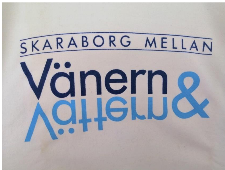
Den framgångsrika devisen

deofilm och diverse profilprodukter blev verktyg för ambassadörer som vitt och brett spred kunskap om länet.